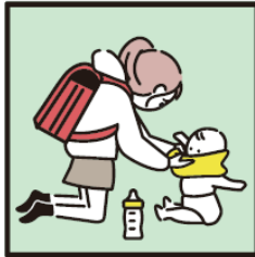
家族に代わり、幼いきょうだいの世話をしている。