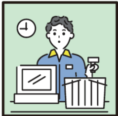
家計を支えるために労働をして、障がいや病気のある家族を助けている。