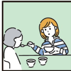
障がいや病気のある家族の身の回りの世話をしている。