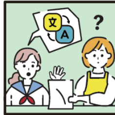
日本語が第一言語でない家族や障がいのある家族のために通訳をしている。