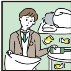
アルコール・薬物・ギャンブル問題を抱える家族に対応している。