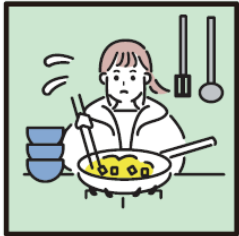
障がいや病気のある家族に代わり、買い物・料理・掃除・洗濯などの家事をしている。

ヤングケアラーを支援につなぐにあたっては、本人の意思を尊重すること、本人や家族の想いを第一に考えることが重要です。本人や家族との対話の中で緊急性を確認した上で、信頼関係を築きながら状況の把握をお願いします。