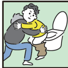
障がいや病気のある家族の入浴やトイレの介助をしている。

ヤングケアラーの支援については 市区町村の「こども家庭センター」 又は児童福祉担当部署までご連絡ください