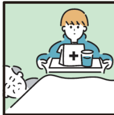
がん・難病・精神疾患など慢性的な病気の家族の看病をしている。